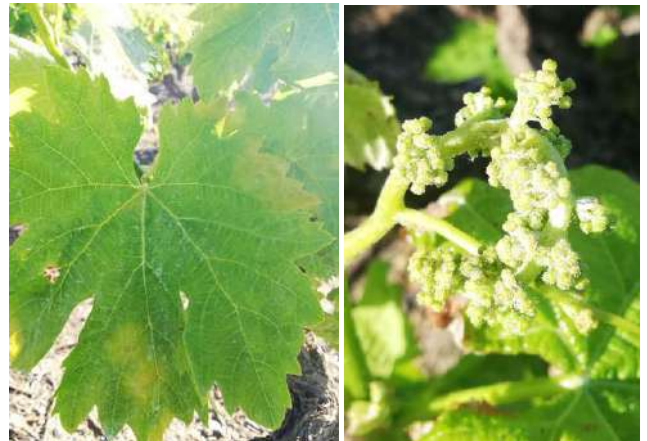
Mildiou : Tache d'huile de mildiou et symptôme sur inflorescence.

Les prochaines pluies et contaminations pourraient être déterminantes pour ce millésime.