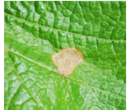
Tache de black rot avec présence de pycnides

Evaluation du risque : VIGILANCE. Rechercher les symptômes et surveiller leur évolution.